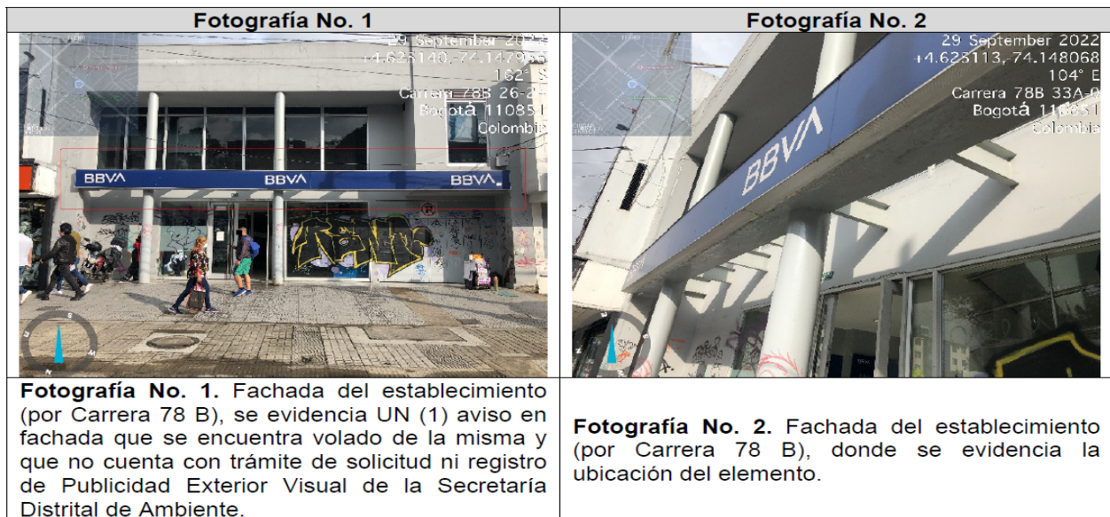
Tabla 3. Registro fotográfico